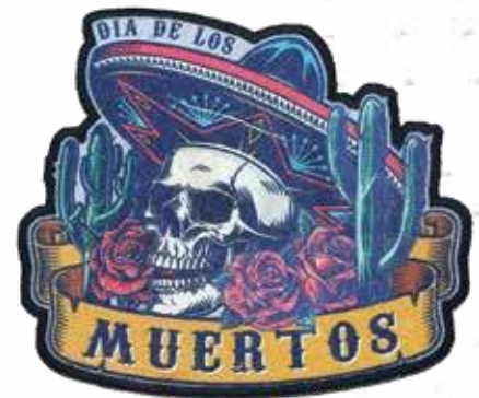
SUBLIMATION AUF STICKEREI