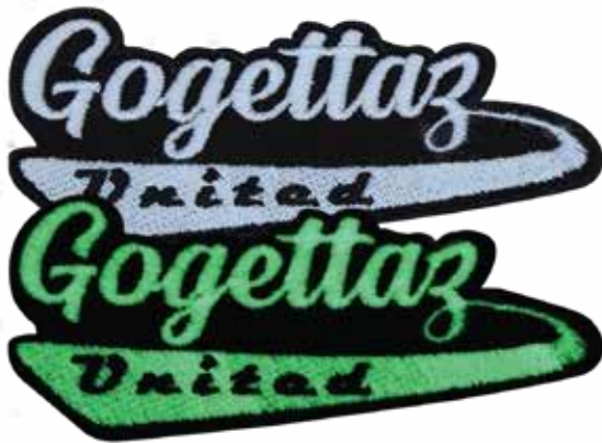
IM DUNKELN LEUCHTEN