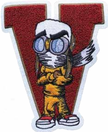
STICKEREI + CHENILLE