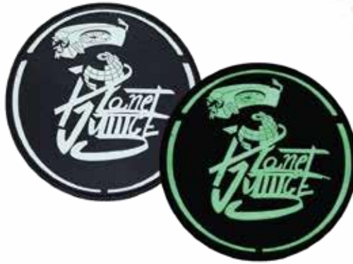
IM DUNKELN LEUCHTEN