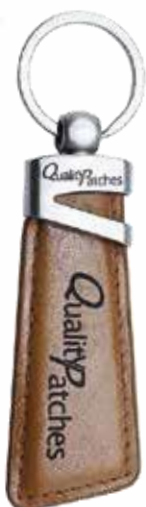
SCHLÜSSELANHÄNGER AUS LEDER