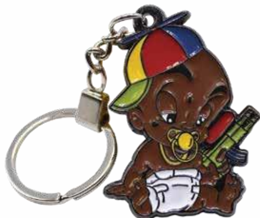
SCHLÜSSELANHÄNGER AUS METALL