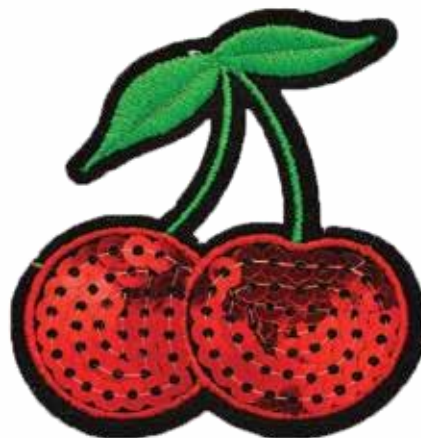
PAILLETTEN + STICKEREI