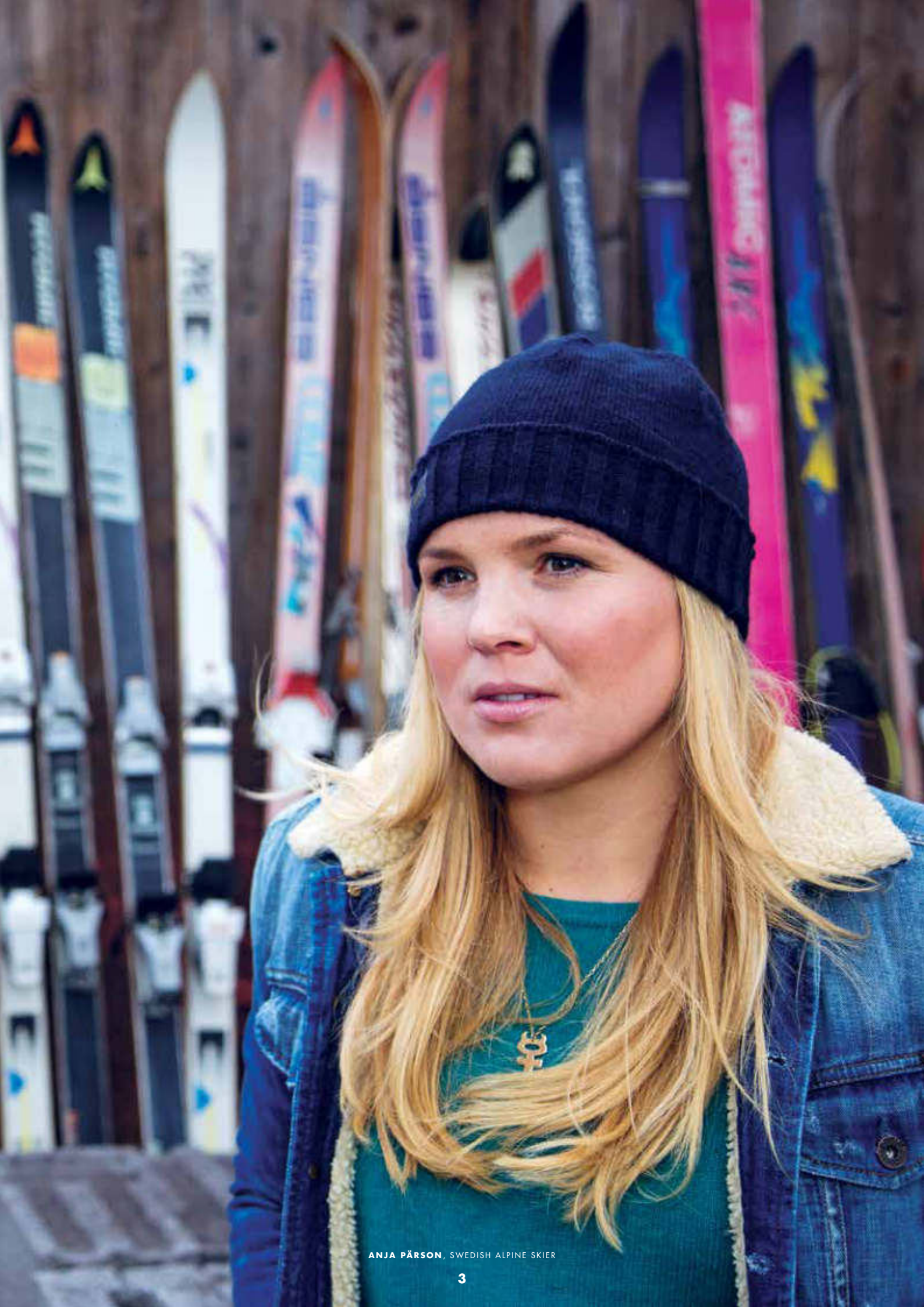
ANJA PÄRSON, SWEDISH ALPINE SKIER